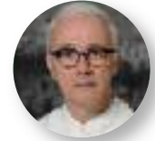
cfr. Rony Ceustermans

De wieg van de Europese cultuur staat in Griekenland. Het binnenland is bergachtig en helemaal niet vruchtbaar. De Grieken hebben zich daarom altijd naar de zee gekeerd en ze groeiden uit tot een succesvol handelsvolk. Samen met allerhande goederen werden ook kennis en wetenschap geïmporteerd uit verre oorden, vooral uit Egypte en het Tweestromenland.