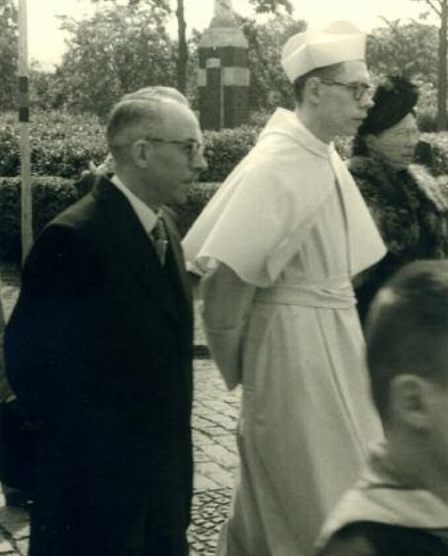
Eremis (1951), samen met zijn ouders

sermans, die hem vertrouwd maakte met de methode van kardinaal Cardijn.