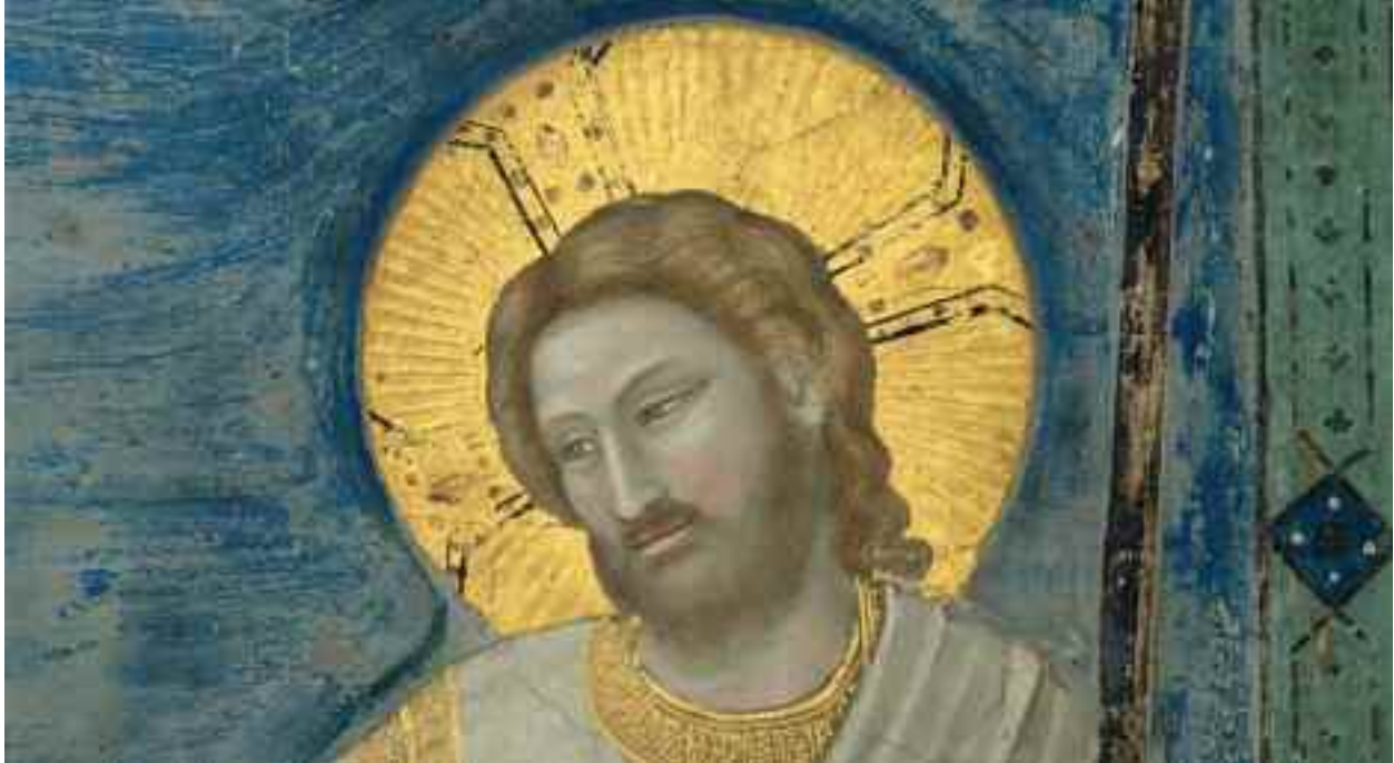
Verrezen Christus, fresco door Giotto, Scrovegni-kapel, Padoua, 1304 (detail)

Een bezinning op het evangelie van de paaswake (Mt 28,1-10)