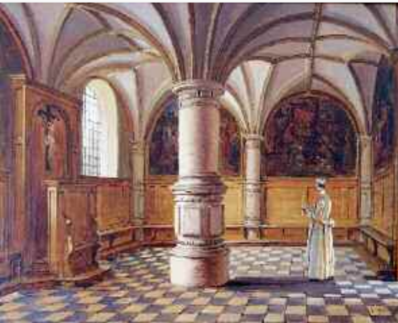
De kapittelzaal van de abdij van Park, geschilderd op 9 augustus 1866

Na aankoop werden de twee schilderijen opgeknapt door Bert Nordin uit Antwerpen. Enkele jaren geleden heeft hij ook een aantal abtspportretten in Averbode gereinigd en opnieuw vernist. Na het reinigen werd duidelijk dat één van de schilderijen gesigneerd is door de kunstenaar. Op het interieur van de kapittelzaal van de abdij van Park vindt men onder