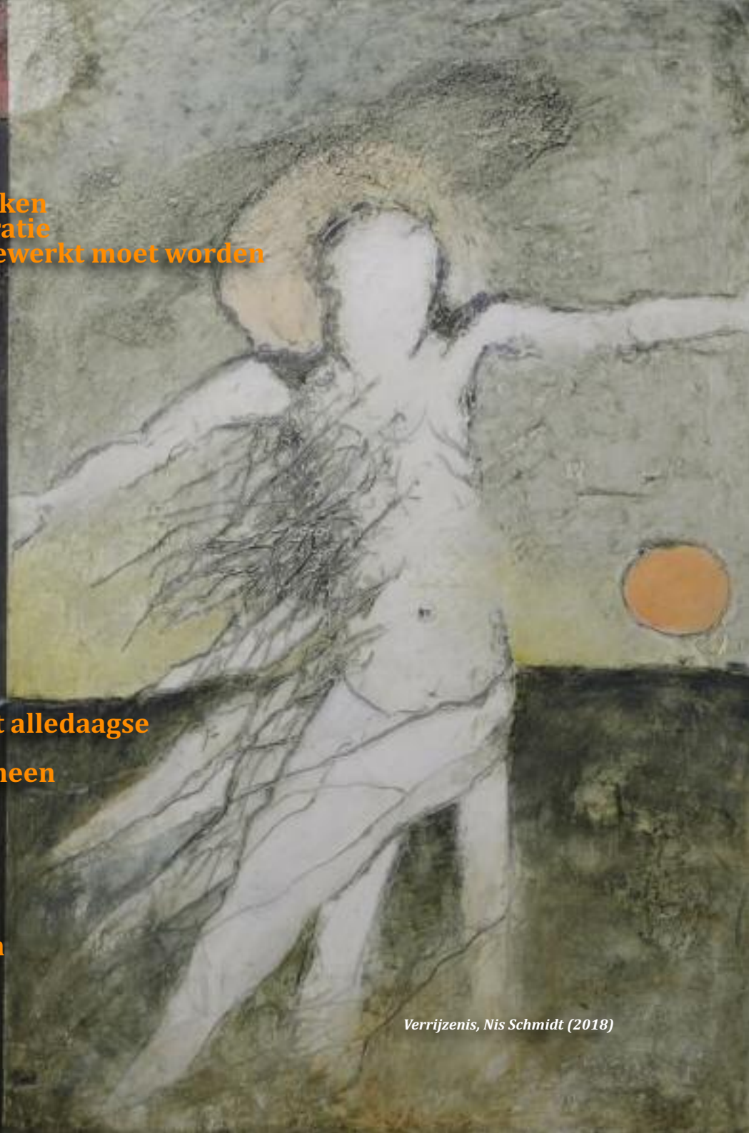
Verrijzenis, Nis Schmidt (2018)